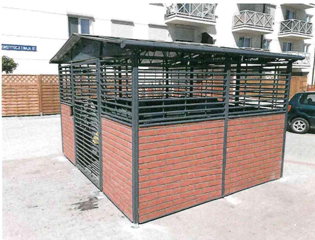
WIDOK ELEWACJI TYLNEJ