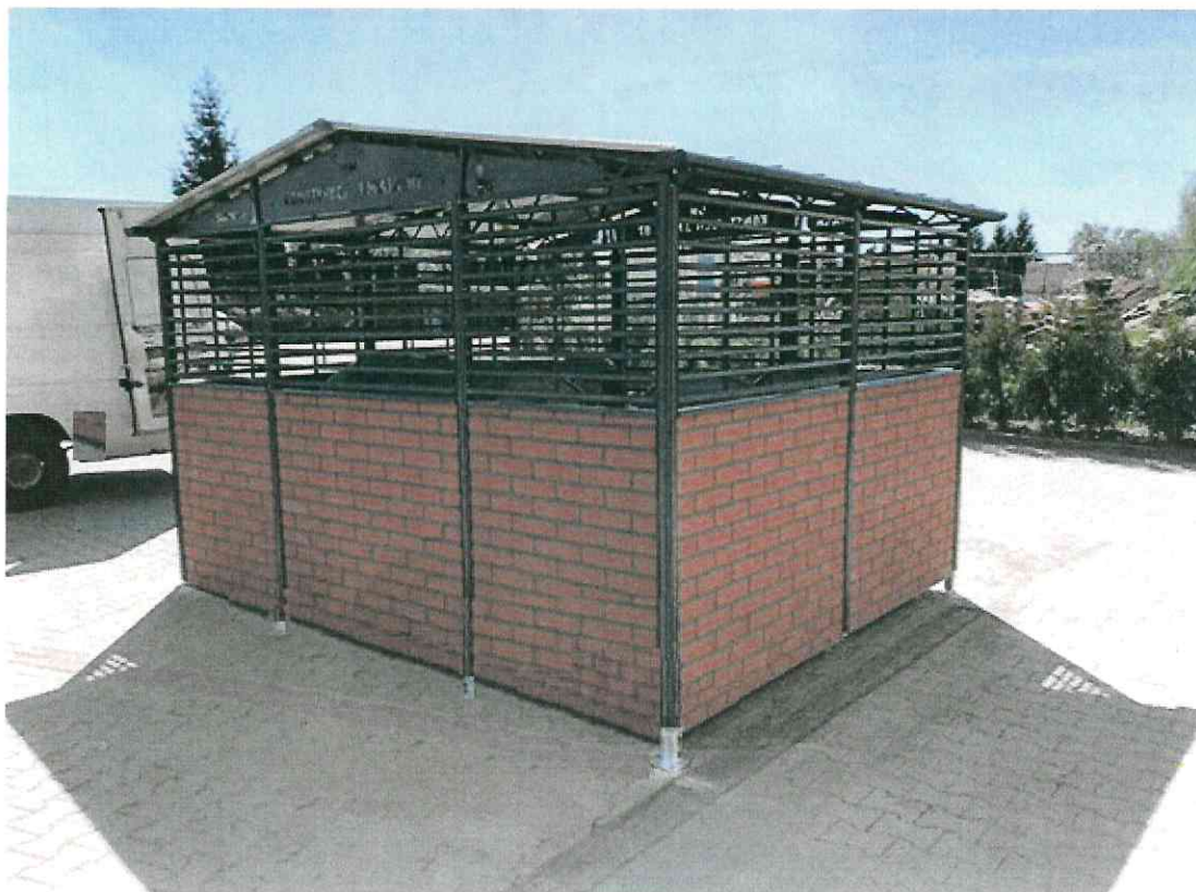
WIDOK ELEWACJI FRONTOWEJ